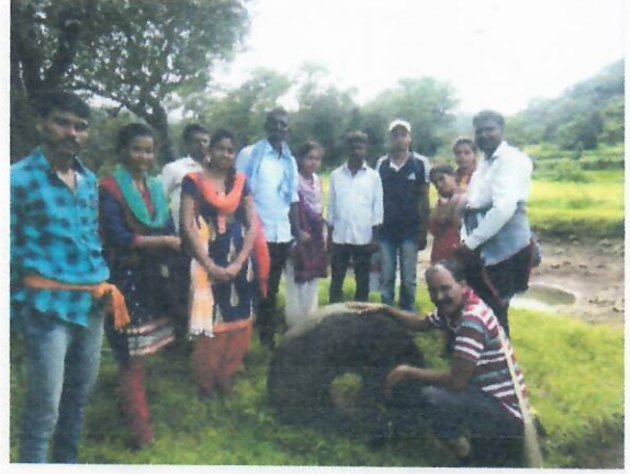
नदी मार्गतील ब्रिटिश काळातील अंतर दर्शविणारे मैलाचे दगड व घोडागाडीचे चाक