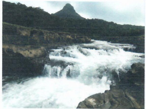
मुळा नदीवरील धबधबा (पेठेचीवाडीजवळ)