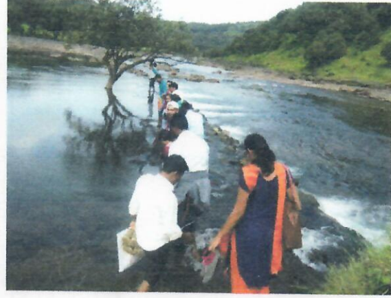
मुळा नदी ओलंडताना