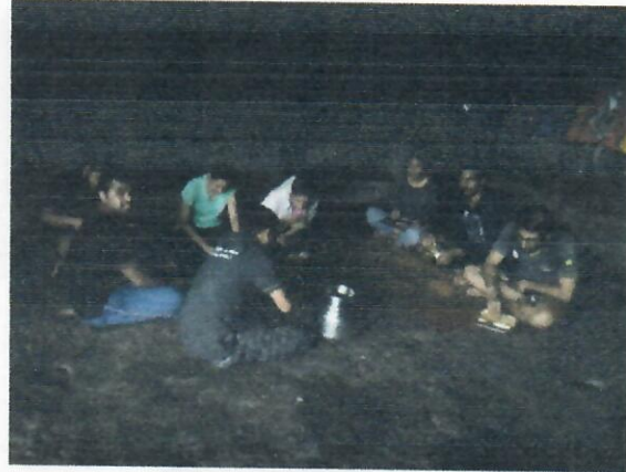
हरिश्चंद्रगडकडे जाण्याचा मार्ग (पाचनई) हरिश्चंद्रगडावरील गुहेतील जेवणाचा आस्वाद