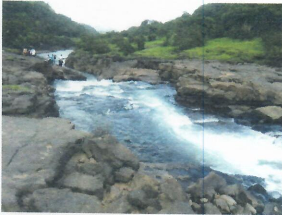
नदी पात्रातील भूरूपे