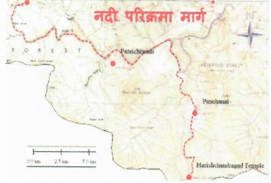
नदी परिक्रमा मार्ग