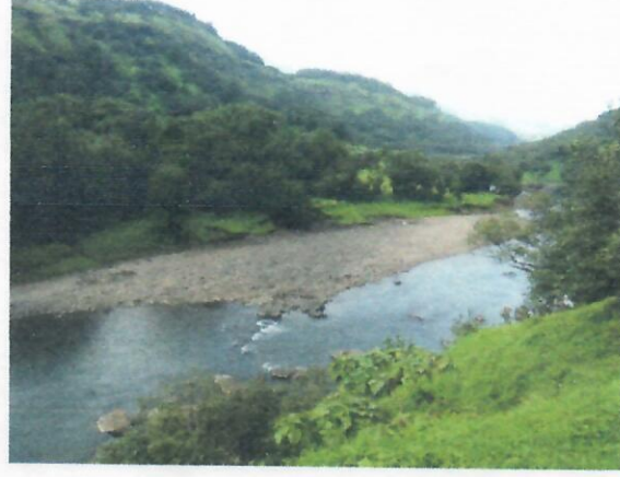
मुळा नदीचे पात्र